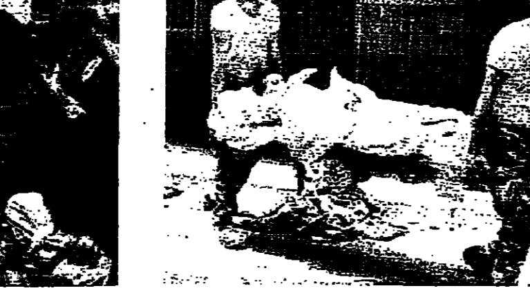
الفتح المدني ينقل الجرحى امام مستشفى غزة